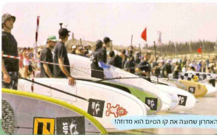
האחרון שחוצה את קו הסיום הוא מדודה!

עמית: "הייתי בטיול בפיג'י וכששטנו על אחת היאכטות, ראיתי גלשן SUP ונדלקתי. לדעתי זה הולך לתפוס בארץ ממש כמו לרכוב על אופניים, אבל רק בים. זו כבר השנה השלישית שאנחנו מקדמים את הנושא. מה שיפה בתחום הזה הוא שאפשר להתחרות בכל מקום: בים, בנהר ובאגם".